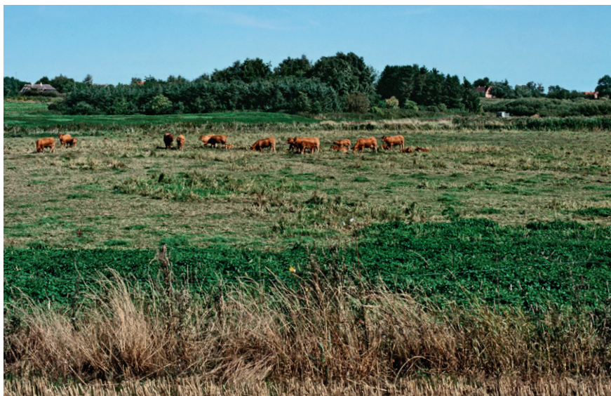
Søen lå i august 2005 som en fugtig eng med rørskov, granplantage og lidt popler og pilekrat. Her blev taget wrapfoto, og der gik 15-20 kvæg og græssede. Kultivering lykkedes aldrig på grund af sætninger i den dyndede søbund.