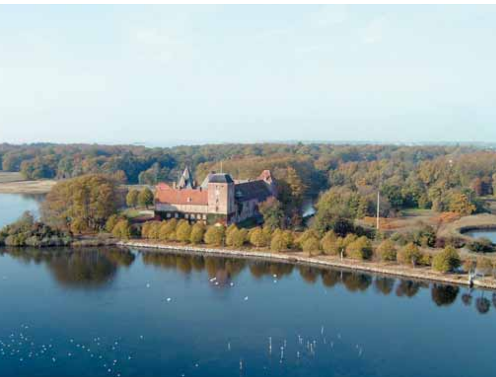
Ålholm Slot. Indtil renessancen var Nysted en købstad, hvis indbyggere havde pligt til at yde vorned på kongens slot, Ålholm.

Privilegiebrevene fungerer ofte som byernes dåbsattest, og når en by i middelalderen var ophøjet til købstad, indsatte kongen sin foged i byen. Han skulle blandt andet opkræve de skatter, som kongen forlangte for at beskytte købstaden. Beskyttelsen kunne være mod andre hertuger og mod sørøvere, men samtidig sikrede kongen også juridisk lovfæstelse af byen. Skatten bestod i en afgift af omsætningen fra byens torv, og således er moms ikke et nyt fænomen. Senere i historiens løb lagde kongen sin myndighed i byen i hænderne på et råd. Byrådet valgte en borgmester og udnævnte en kærner eller skatteopkræver.